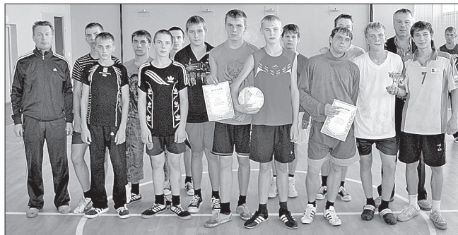
Группа электромонтёров — победитель по мини-футболу

Училище давно дружит со спортом. Сегодня здесь созданы группы общефизической подготовки, работают 15 спортивных секций. Выбор большой: это и игровые виды спорта, и бокс, и вольная борьба, настольный хоккей и многое другое. А какой парень не мечтает быть сильным, выносливым? Занятия бесплатные, поэтому некоторые ребята посещают даже несколько секций и добиваются хороших результатов. ПУ-1 уверенно занимает лидирующие позиции по спорту среди профессиональных училищ и техникумов. В прошлом учебном году, например, все призовые